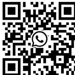
Código QR – Garantia